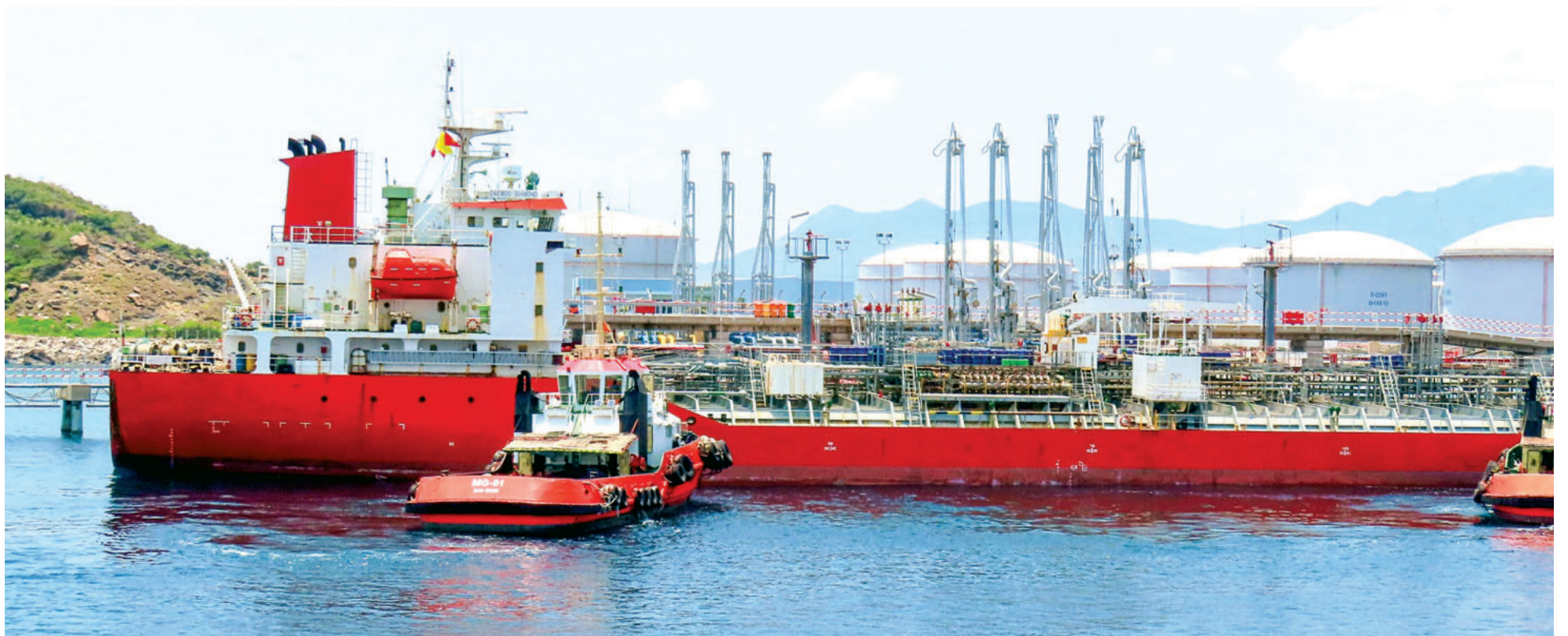
● Kho xăng dầu trên đảo Mỹ Giang hiện nay.