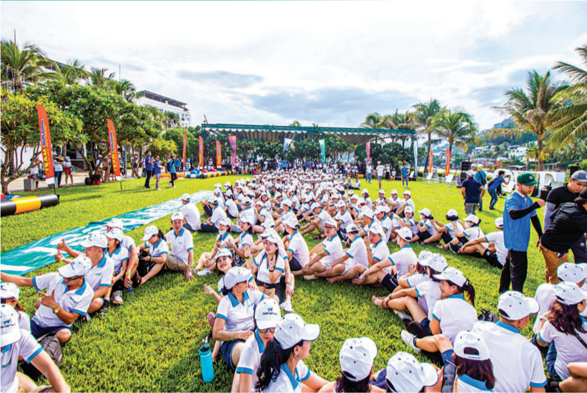
● Khách du lịch MICE tổ chức team building tại Khu du lịch Champa Island.

Với cơ sở hạ tầng du lịch phát triển, giao thông thuận lợi, Khánh Hòa có nhiều lợi thế để phát triển du lịch MICE (Meeting Incentive Conference Event - du lịch kết hợp hội nghị, hội thảo, triển lãm, tổ chức sự kiện). Ngành Du lịch tỉnh đang đẩy mạnh phát triển du lịch MICE để hướng du lịch phát triển bền vững.