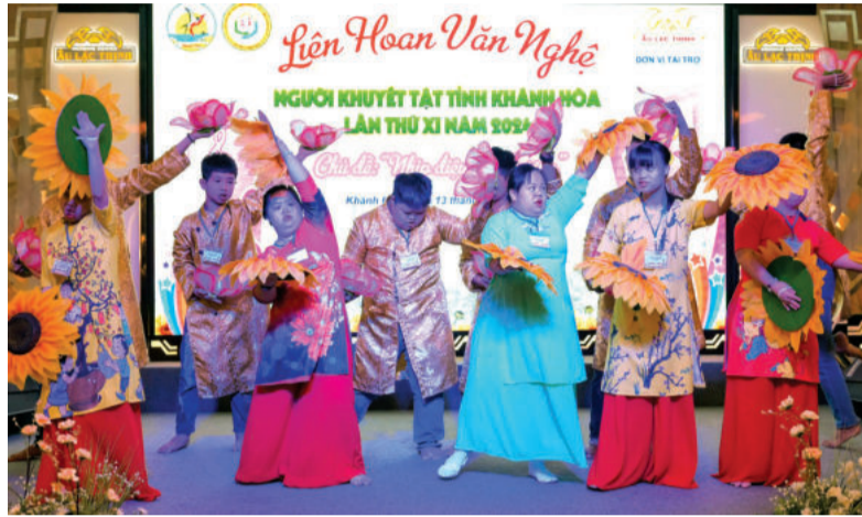
● Một tiết mục tham gia liên hoan.