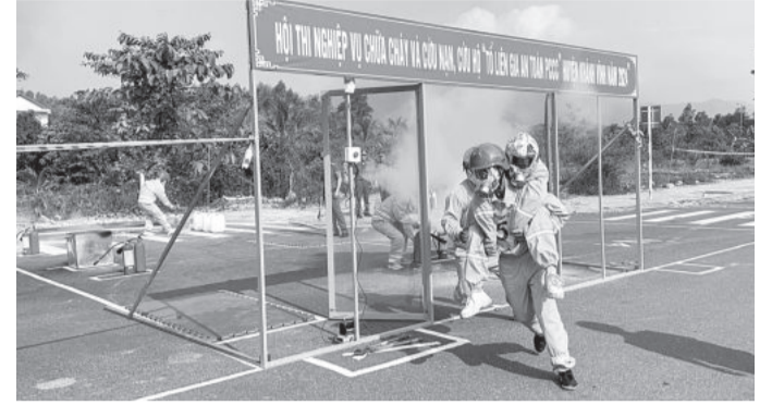
● Các đội thi phân thực hành.

Ngày 19-4, UBND huyện Khánh Vĩnh tổ chức Hội thi nghiệp vụ chữa cháy và cứu nạn, cứu hộ "Tổ liên gia an toàn phòng cháy, chữa cháy" năm 2024. Tham gia thi có 13 tổ liên gia an toàn phòng cháy, chữa cháy, mỗi tổ gồm 8 thành viên, đại diện các xã, thị trấn trên địa bàn huyện.