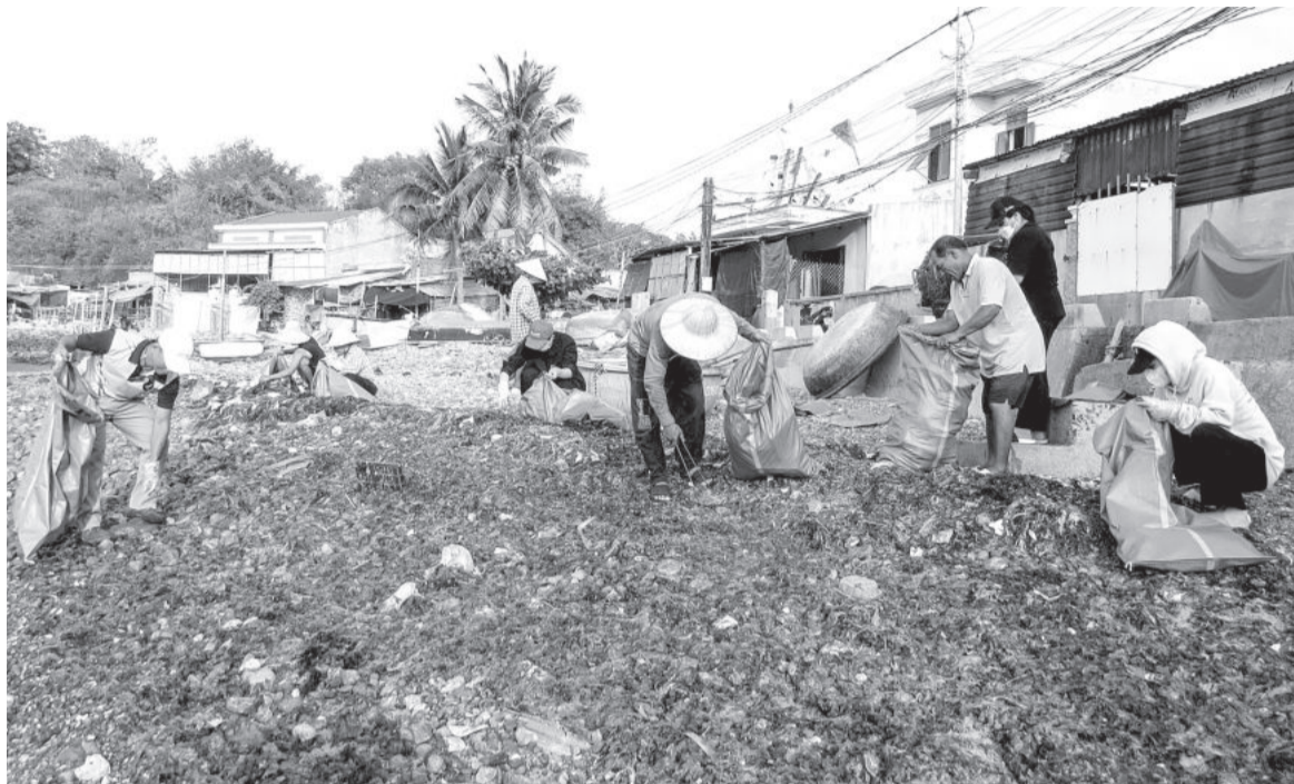
● Các tình nguyện viên và người dân nhặt rác bị sóng đánh dạt vào bờ.

Hoạt động từ cuối tháng 3-2024, các thành viên của Hội Yêu rác xanh đã cùng nhau nhặt rác trên bờ, vớt rác dưới biển, làm cho cảnh quan thêm sạch đẹp và lan tỏa lối sống xanh, kêu gọi mọi người chung tay bảo vệ môi trường.