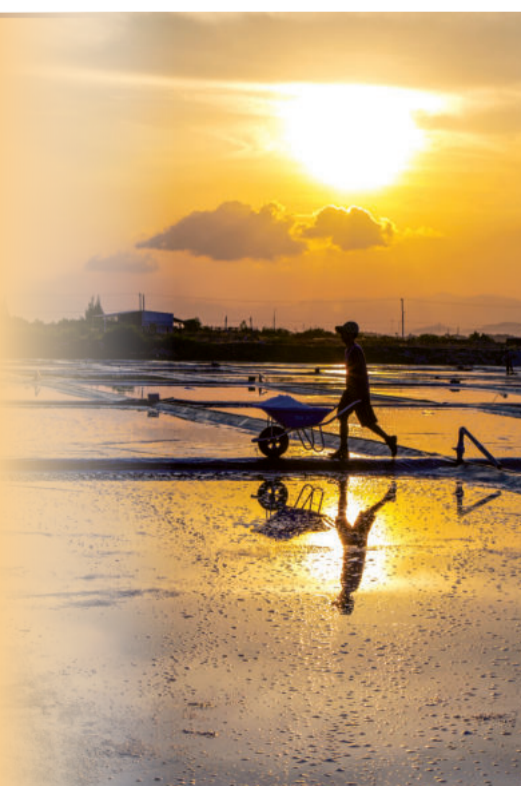
● Việc thu hoạch muối thường bắt đầu từ 14 giờ và hoàn thành lúc mặt trời sắp lặn.

● Diêm dân phường Ninh Diêm nhận nhíp thu hoạch muối.