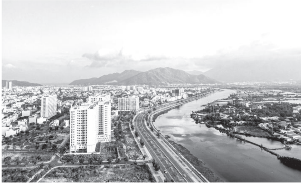
• Các tòa chung cư nhà ở xã hội ở Khu đô thị mới Lê Hồng Phong I (TP. Nha Trang).

tích nhà ở tăng thêm khoảng 25,8 triệu m 2 sàn, tương đương với 282.722 căn); nhà ở kiên cố và nhà ở bán kiên cố đạt tỷ lệ 100%, không phát sinh thêm nhà ở thiếu kiên cố và đơn sơ.