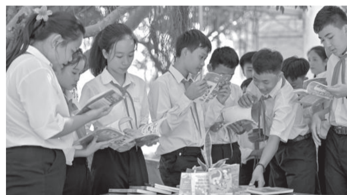
● Các em học sinh thích thú khi tham gia chương trình.

Ngày 19-4, UBND thị xã Ninh Hòa tổ chức Ngày Sách và Văn hóa đọc Việt Nam (21-4) tại hai điểm: Trường THCS Phạm Hồng Thái (xã Ninh Thân) và Trường THPT Nguyễn Chí Thanh (xã Ninh Phụng).