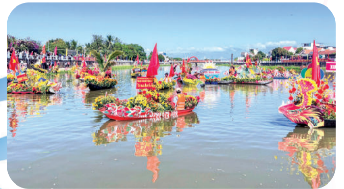
● Đua thuyền trên sông Dinh.