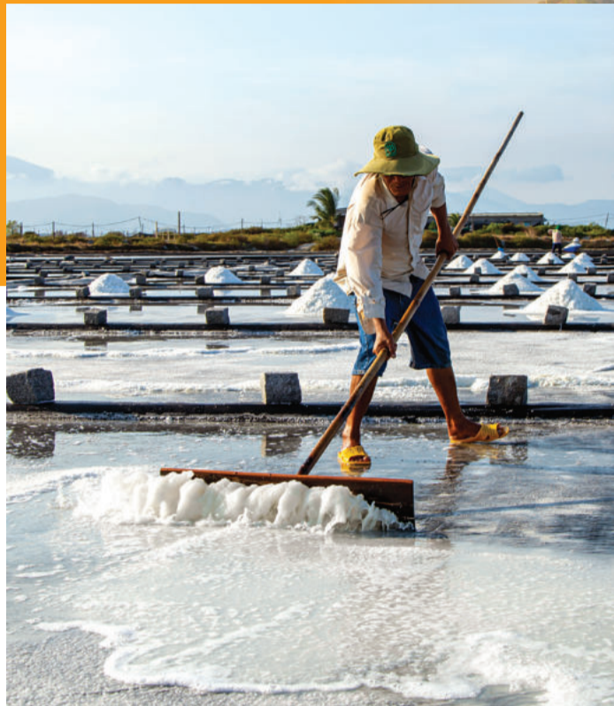
● Cào muối khoảng 4 giờ/ngày, diêm dân được trả công 350.000 đồng.

Năm nay, thời tiết nắng nóng giúp sản lượng muối ở khu vực Hòn Khói (thị xã Ninh Hòa) tăng gần gấp đôi so với cùng kỳ năm trước. Tuy nhiên, giá muối giảm nên niềm vui của diêm dân chưa trọn vẹn.