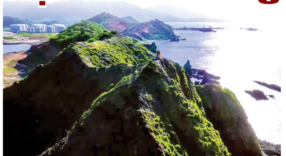
● Toàn cảnh "sống lưng khủng long" Mỹ Giang, xa xa là các bể chứa xăng dầu.

Từ đó tới giờ, tháng 4 năm nay tôi mới quay lại Mỹ Giang mà không hề hẹn trước. Cảm giác bồi hồi là có thật. Tất nhiên tôi biết Mỹ Giang nay đã nằm trong quy mô cụm công nghiệp Nam Vân Phong cùng với Nhà máy đóng tàu Hyundai Việt Nam, Cảng tổng hợp Nam Vân Phong, Nhà máy nhiệt điện BOT Vân Phong. Từ năm 2012, Kho ngoại quan xăng dầu Vân Phong đã đi vào hoạt động vận hành ngay trên hòn đảo khô cằn này với tổng diện tích trên đất 56,7ha và 42ha mặt biển. Hai cây cầu bê tông nối đất liền và đảo, một được làm từ năm 2008 đi qua khu vực dân cư, cầu mới bê thế hơn xây năm 2019 kết nối ra thẳng tỉnh lộ. Bước chân lên nơi ngày xưa chỉ là đồi núi hoang vu chơ vơ giữa biển, giờ trở thành một vị trí chiến lược an ninh cao với kho xăng dầu có tổng sức chứa lên tới 505.000m 3 trong 29 bể chứa, hệ thống 4 cầu cảng có thể tiếp nhận tàu trọng tải lên đến 150.000 tấn mà không khỏi bàng