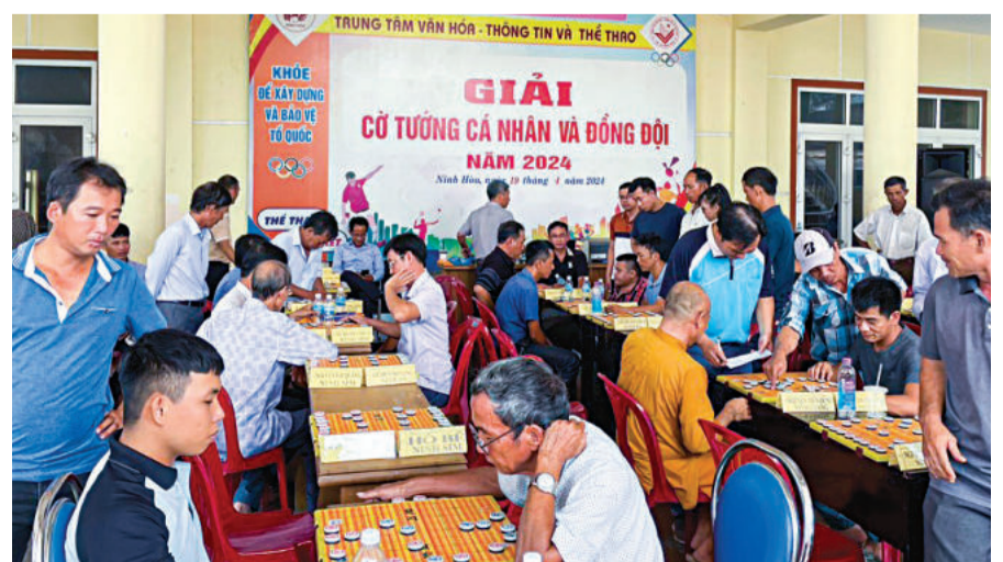
● Các kỳ thủ tham gia tranh tài tại giải.