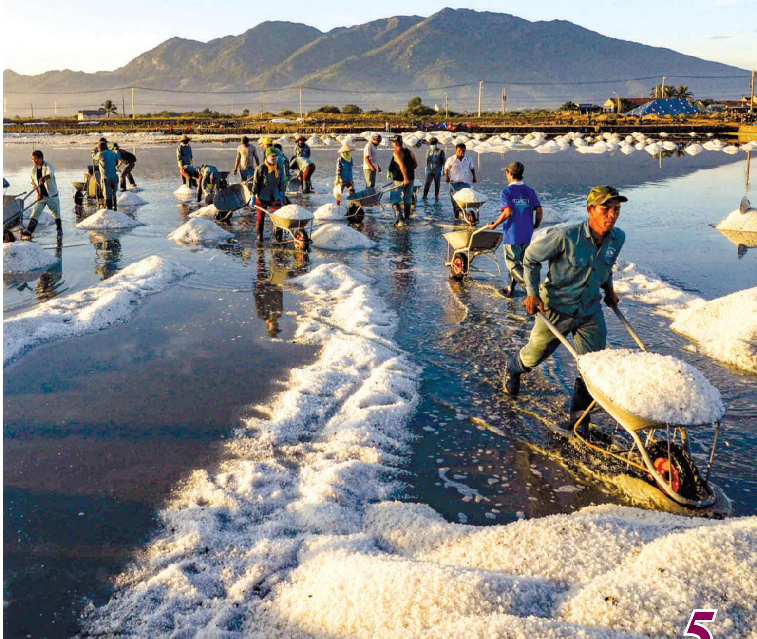
• Diêm dân nhộn nhịp thu hoạch muối.