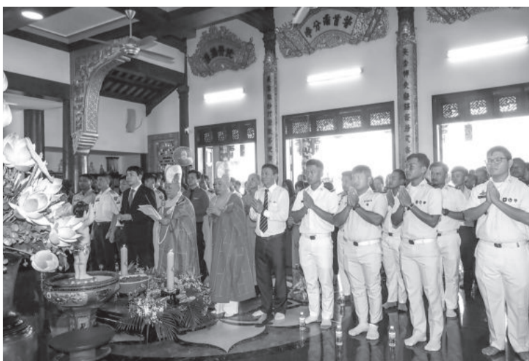
● Sinh viên, học viên Lào và Campuchia cùng các đại biểu thực hiện lễ Phật.

Các sinh viên, học viên Lào, Campuchia đến từ Trường Đại học Khánh Hòa, Trường Đại học Nha Trang, Trường Sĩ quan Thông tin, Trường Sĩ quan Không quân, Học viện Hải quân đã cùng tham gia các hoạt động như: Dâng lễ chùa; đọc kinh cầu an, các nghi thức đón Tết cổ truyền Lào và Campuchia; thực hiện nghi thức tắm Phật; buộc