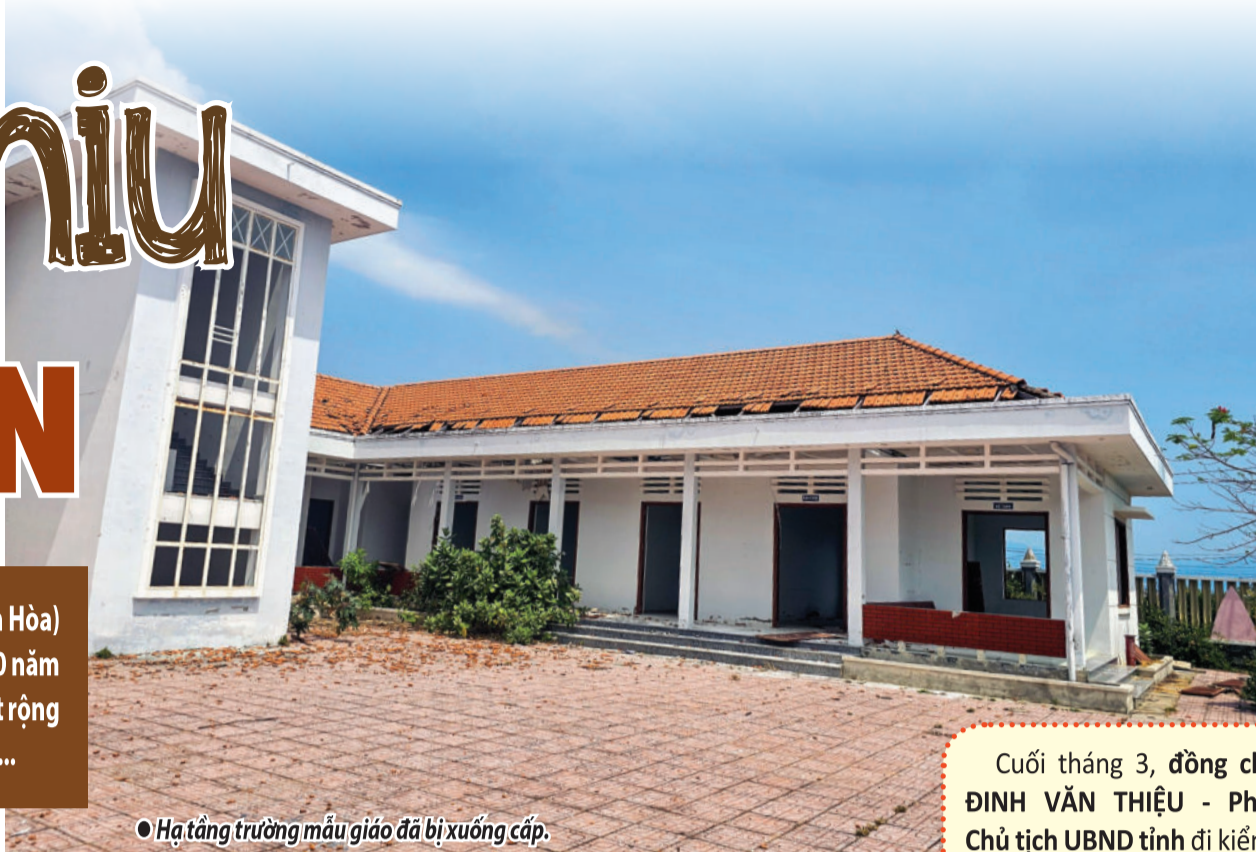
● Hạ tầng trường mẫu giáo đã bị xuống cấp.