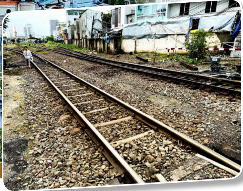
● Ga Nha Trang.

Nha Trang là một thành phố nhỏ bé và xinh đẹp, nhỏ bé nên thứ gì cũng gần gũi, những ngã ba, ngã tư rất gần nhau và dễ dàng để tìm đến những nơi nổi tiếng vì tất cả đều nằm trong phố. Nha Trang gần Cảng hàng không quốc tế Cam Ranh hiện đại, có một cảng tàu thủy rộng lớn có thể đón những chiếc tàu quốc tế mang hàng ngàn du khách đến đây. Nhưng thứ làm cho người ta nhớ nhiều nhất lại là ga xe lửa. Ga Nha Trang nằm ngay trung tâm thành phố, là một di tích lịch sử. Với người dân Nha Trang, đây là một nơi phải được trân trọng giữ gìn và bảo vệ. Người Nha Trang tự hào rằng, từ ga Nha Trang mình có thể đi khắp nơi, ra Bắc vào Nam rất dễ dàng.