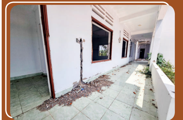
● Hành lang các phòng đều bị kẻ gian đào bới lấy dây điện.