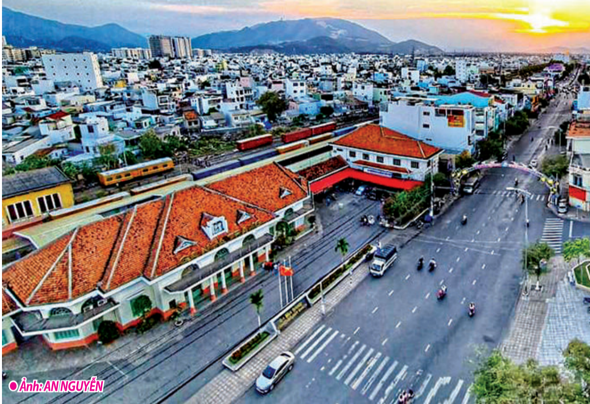
● Ảnh: AN NGUYỄN