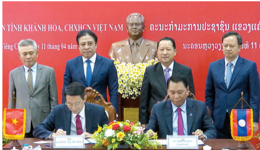
● Lãnh đạo tỉnh Khánh Hòa và Thủ đô Viêng Chăn ký kết Bản ghi nhớ.