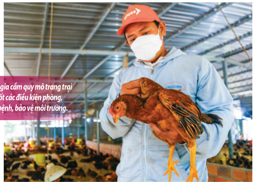
● Người nuôi gia cầm quy mô trang trại tuân thủ tốt các điều kiện phòng, chống dịch bệnh, bảo vệ môi trường.

Theo lãnh đạo Chi cục Chăn nuôi và Thú y tỉnh, quan điểm của cơ quan quản lý muốn người chăn nuôi tập trung vào các trang trại nhằm kiểm soát tốt hơn dịch bệnh. Tuy nhiên, còn nhiều hộ dân, nhất là ở vùng nông thôn nuôi gà thả vườn hoặc bán thả vườn tận dụng thức ăn, lao động nông nhàn nhằm cải thiện thu nhập, cuộc sống. Do đó, công tác phòng, chống dịch bệnh trên đàn gia cầm luôn được quan tâm ở cả 2 hình thức chăn nuôi quy mô trang trại và nông hộ.