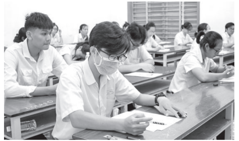
● Thí sinh tham dự kỳ thi tốt nghiệp THPT năm 2023.

UBND tỉnh vừa ban hành Chỉ thị về việc tổ chức kỳ thi tốt nghiệp THPT năm 2024 và công tác tuyển sinh năm học 2024 - 2025 trên địa bàn tỉnh.