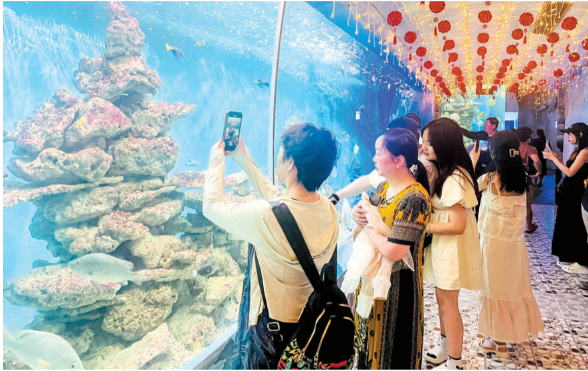
● Khách du lịch Trung Quốc tham quan Bảo tàng Hải dương học.