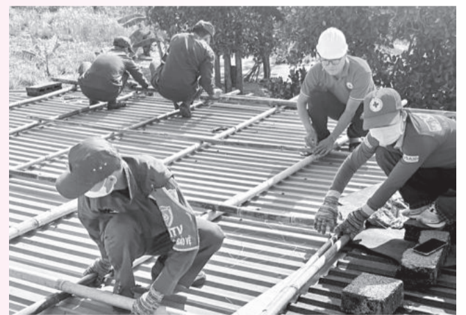
● Các học viên thực hành chằng, chống nhà ở cho người dân.

● Ngày 11 và 12-4, Hội Chữ thập đỏ tỉnh phối hợp với Trung ương Hội Chữ thập đỏ Việt Nam tổ chức lớp tập huấn về hành động sớm ứng phó gió bão - Kiến thức và kỹ năng chằng, chống nhà ở cho lực lượng làm công tác phòng, chống thiên tai phường Cam Nghĩa, TP. Cam Ranh. Các học viên được cập nhật kiến thức về tăng cường khả năng thực hiện các hành động sớm; kỹ thuật chằng, chống nhà ở trong vòng 60 - 72 giờ trước khi gió, bão đổ bộ; thực hành thực tế chằng, chống nhà ở cho 5 hộ dân trên địa bàn phường. Lớp tập huấn nằm trong Dự án "Nâng cao năng lực ứng phó khẩn cấp cho Hội Chữ thập đỏ Việt Nam", do Cơ quan Phát triển Quốc tế Hoa Kỳ tài trợ. Sau phường Cam Nghĩa, dự án sẽ triển khai thêm 9 lớp ở 9 xã, phường trên địa bàn tỉnh có nguy cơ bị ảnh hưởng cao bởi gió, bão. (C.Đan)