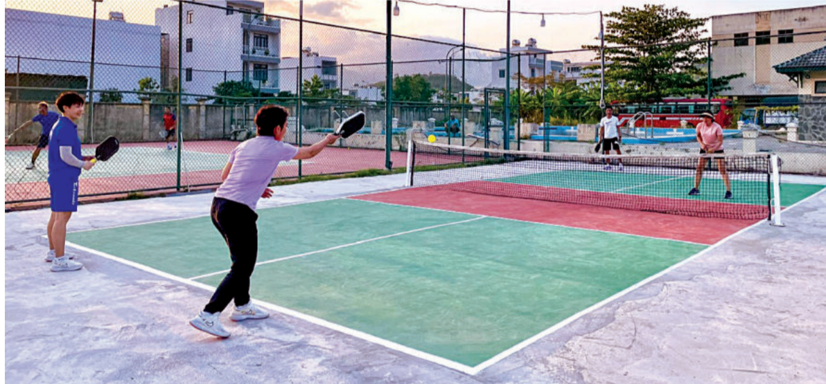
● Một trận đấu pickleball đánh đôi.

thể tận dụng sân mặt xi măng, thảm gỗ hoặc thảm chuyên dụng; mặt sân có diện tích nhỏ hơn sân cầu lông, quần vợt; vợt (hay còn gọi là mái chèo) to hơn