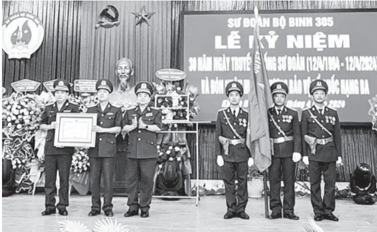
● Sư đoàn vinh dự đón nhận Huân chương Bảo vệ Tổ quốc hạng Ba.

Cách đây hơn 30 năm, sau khi hoàn thành nhiệm vụ quốc tế cao cả ở chiến trường Đông Bắc Campuchia, lực lượng vũ trang Quân khu 5 tiến hành điều chỉnh biên chế, tinh gọn các đơn vị thường trực, tăng cường các đơn vị dự bị động viên. Ngày 12-4-1994, Bộ trưởng Bộ Quốc phòng ra Quyết định số 197 về việc thành lập khung thường trực sư đoàn trực thuộc Quân khu 5, lấy phiên hiệu là Sư đoàn Bộ binh 305, có nhiệm vụ chính trị trung tâm là phức tra, đăng ký, quản lý huấn luyện