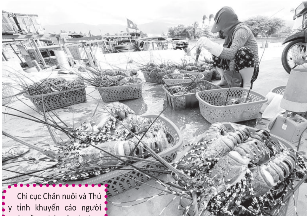
● Người dân bán tôm cho thương lái với giá rẻ.

Khoảng một tháng nay, tôm hùm bông trên địa bàn huyện Vạn Ninh bị chết khá nhiều nhưng chưa rõ nguyên nhân. Cơ quan chức năng đang tìm hiểu, đưa ra các giải pháp để khuyến cáo người dân khắc phục tình trạng này.